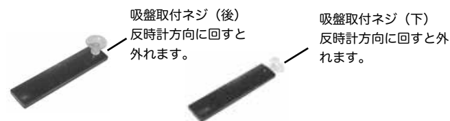
吸盤取付ネジ 取付け例